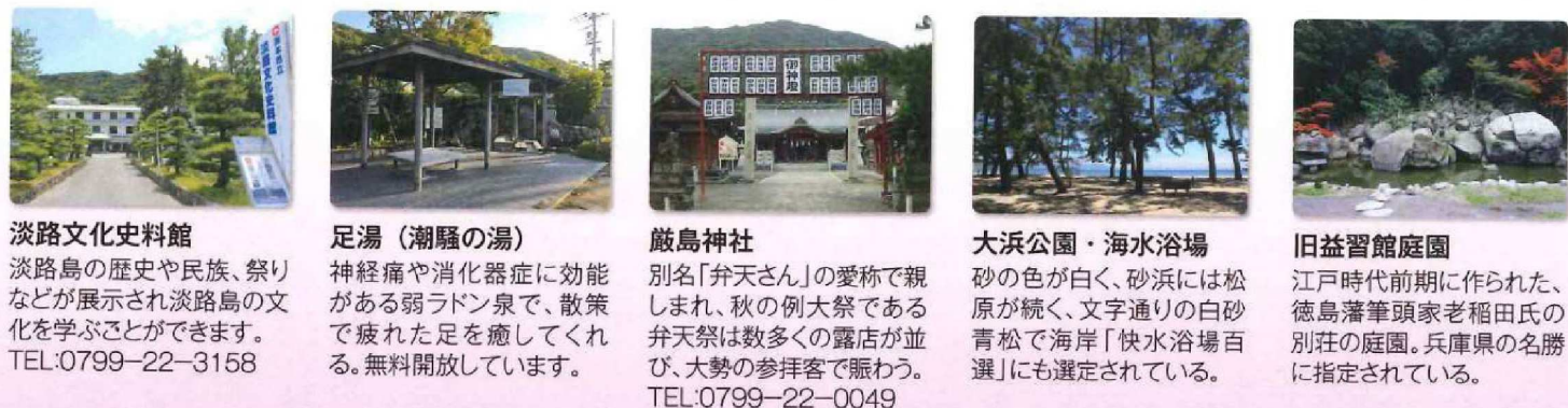
淡路文化史料館 淡路島の歴史や民族、祭りなどが展示され淡路島の文化を学ぶことができます。 TEL:0799-22-3158 足湯(潮騒の湯) 神経痛や消化器症に効果がある弱ラドン泉で、散策で疲れた足を癒してくれます。無料開放しています。 厳島神社 別名「弁天さん」の愛称で親しまれ、秋の例大祭である弁天祭は数多くの露店が並び、大勢の参拝客で賑わう。 TEL:0799-22-0049 大浜公園・海水浴場 砂の色が白く、砂浜には松原が続く、文字通りの白砂青松で海岸「快水浴場百選」にも選定されている。 旧益習館庭園 江戸時代前期に作られた、徳島藩筆頭家老稲田氏の別荘の庭園。兵庫県の名勝に指定されている。